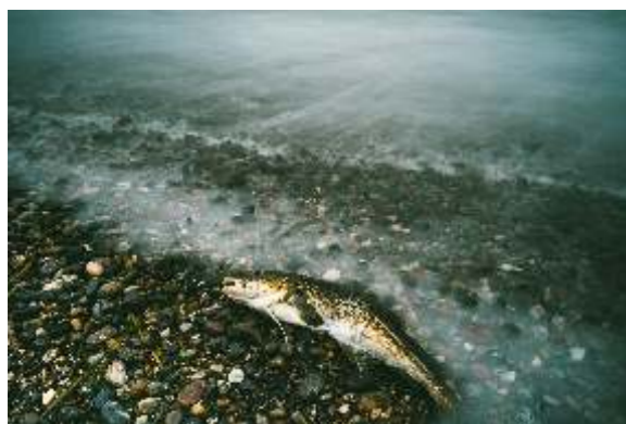
Micaela Lucas One day at the sea 1,3,4