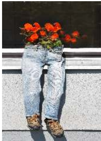
Ewa Grzekowiak Begonia w spodniach