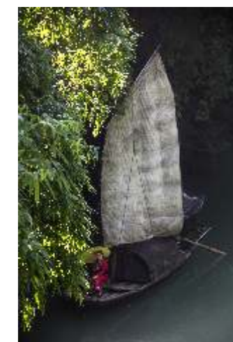
Agnieszka Czarnecka W zieleni 3