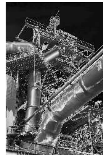
Thomas Kannler Opuszczone fragmenty przemysłu 1,4