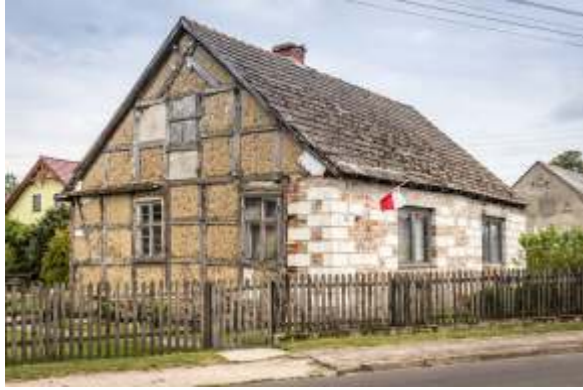
Paweł Ampuła Nasz dom