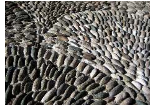
Gra yna wi tek Układanka