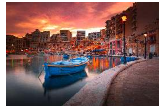
Michał Ampuła O jeden zachód dalej 1,5