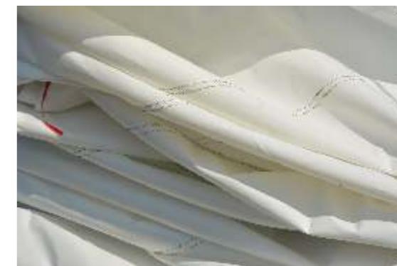
Bogdan Bloch agle