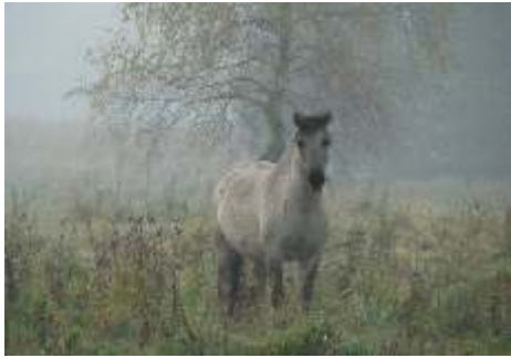
Łucja Prałat Konik Polski