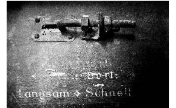
Ya Wang The time maschine