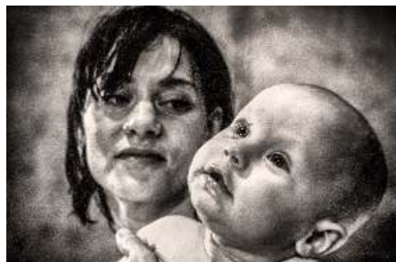
Freude schöner Götterfunken