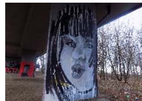
Oliwier Szum Pod mostem 3,4