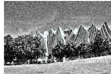
Leszek Szyszłowski Filharmonia 1