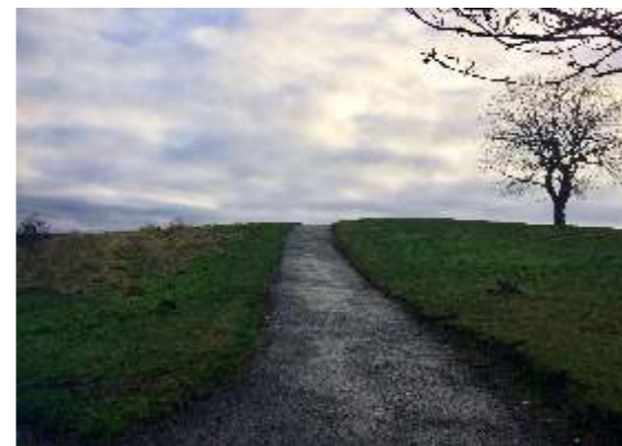
Ewa Szwagrzyk Droga do...1