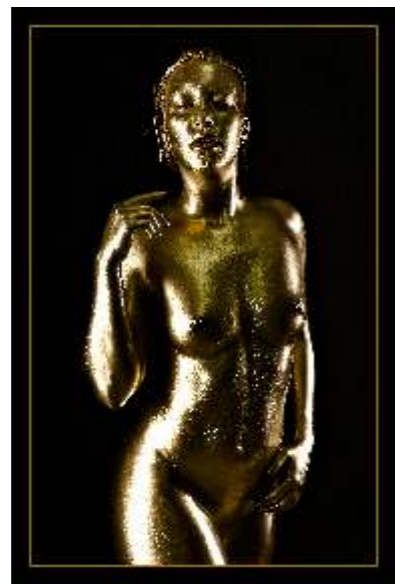
Madame Miau 3

Peter Heibel - wyróżnienie za zdjęcie aktu