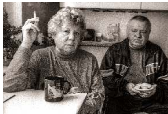
Meine Mama und Mein Papa