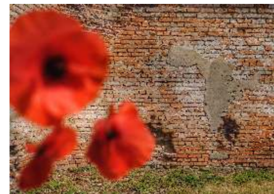
Aleksandra Czarnecka Sonnenberg 3