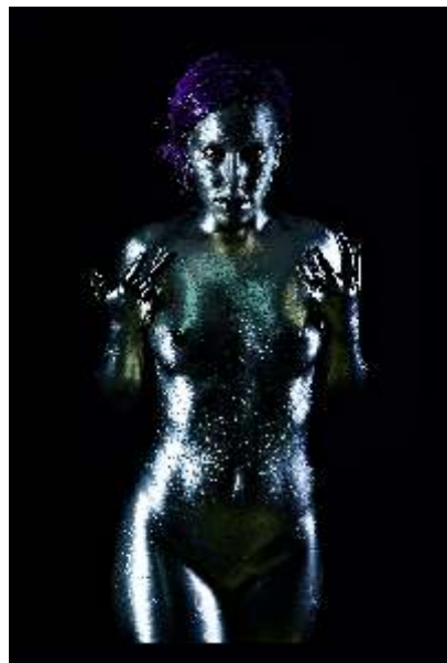
Madame Miau 2