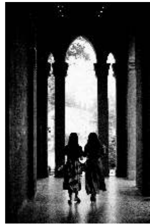
Tomasz Czarnecki wi tynia w Wuhan