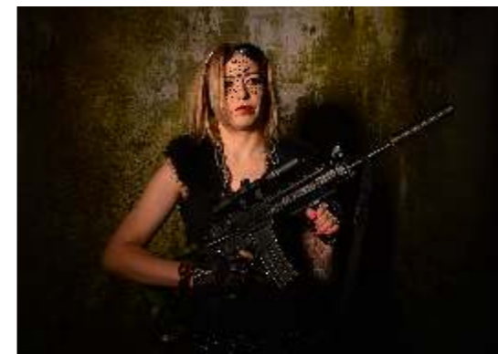
Krystyna Karcz Sfotografowa nasze sny 3