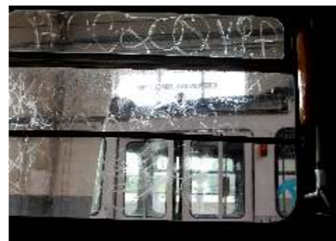
Barbara Krupecka Tabor minionej epoki 4,8,9